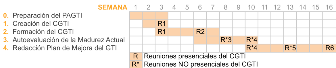
Figura 1. Etapas del Proyecto de Arranque del gobierno de las TI

En los siguientes apartados se describe con detalle cada una de las etapas y las acciones necesarias para completarlas satisfactoriamente.